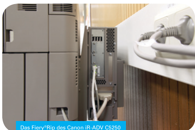
Das Fiery® Rip des Canon iR-ADV C5250

Die wichtigsten technischen Daten des Kyocera FS-9130DN lauten: