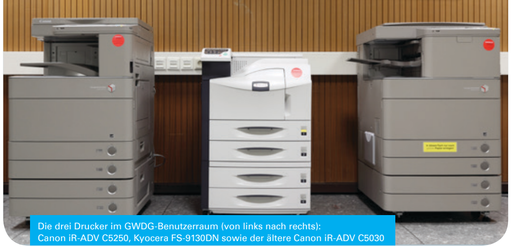
Die drei Drucker im GWDG-Benutzerraum (von links nach rechts): Canon iR-ADV C5250, Kyocera FS-9130DN sowie der ältere Canon iR-ADV C5030